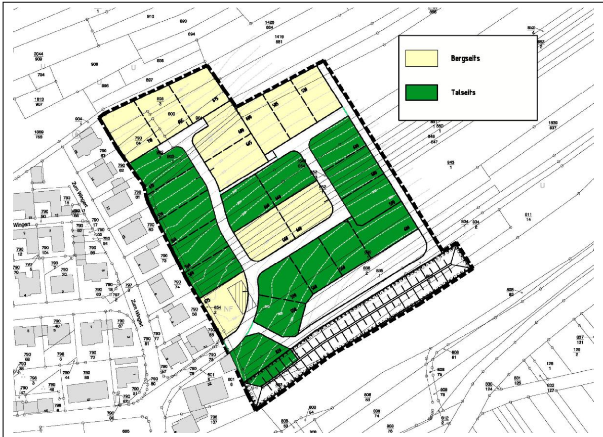
Abb. 3: Definition der Grundstücke in berg- und talseits