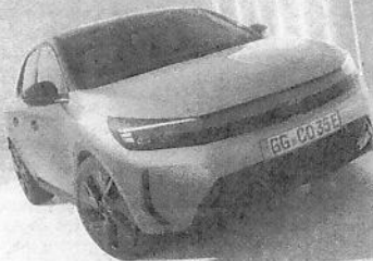
Beispielfoto der Baureihe. Ausstattungsmerkmale nicht Bestandteil des Angebots.

STAATLICHE FÖRDERPRÄMIE BIS ZU 6.000 € Leasingonderrzahlung ggf. durch staatliche Förderung reduzierbar*