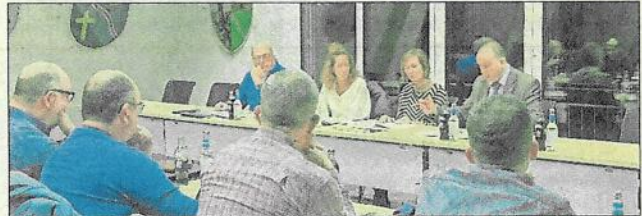
Der Zweckverband „Ferienregion Laacher See“ tagte im Wappensaal der VG-Verwaltung Brohltal in Niederzissen.