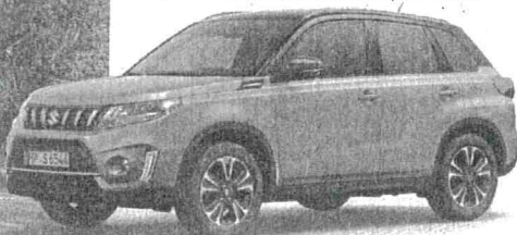
Abb. zeigt Vitara 1.4 BOOSTERJET HYBRID Comfort+ Verbrauchswerte: kombinierter Energieverbrauch 5,3 l/100 km; kombinierter Wert der CO 2 -Emissionen 120 g/km; CO 2 -Klasse: D